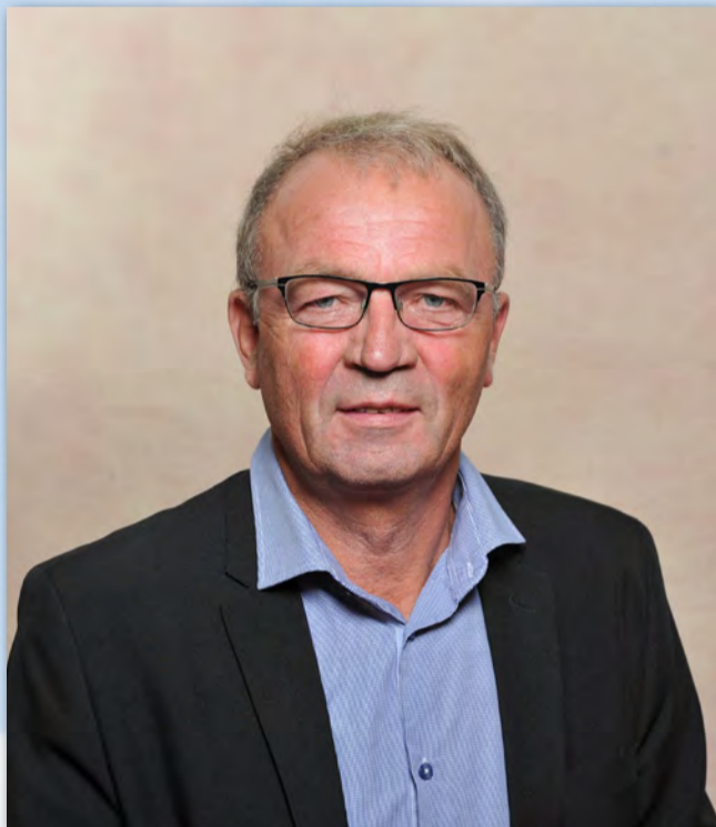
ALAIN DESFOSSES, Président de la Communauté de Communes Somme Sud-Ouest